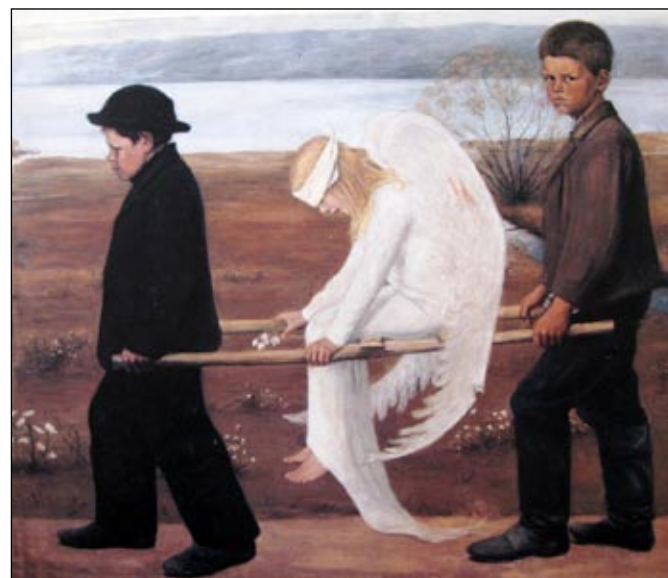
MAALAUS: HUGO SIMBERG; HAAVOITTUNUT ENKELI