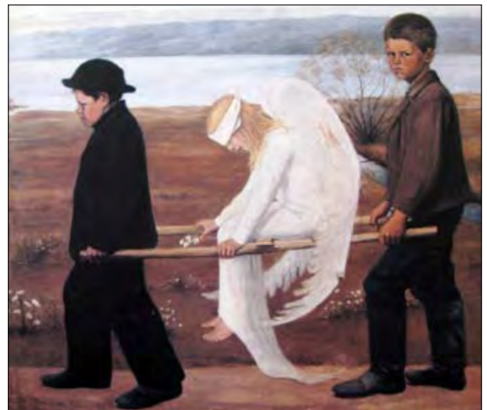
MAALAUUS: HUGO SIMBERG; HAAVOITTUNUT ENKELI